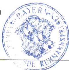
Werner Troiber Erster Bürgermeister